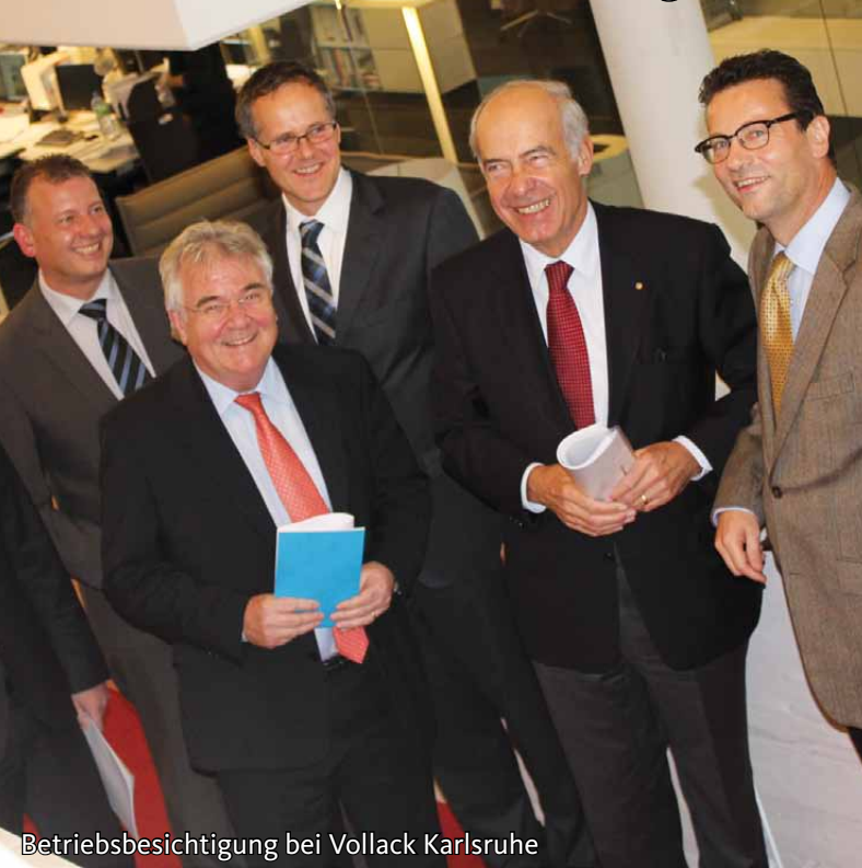
Betriebsbesichtigung bei Vollack Karlsruhe