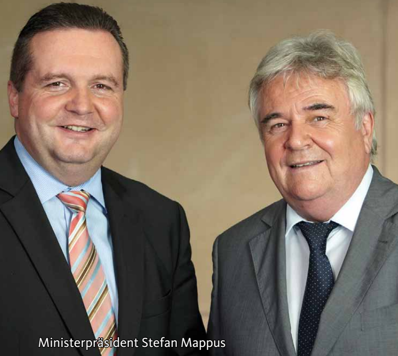
Ministerpräsident Stefan Mappus